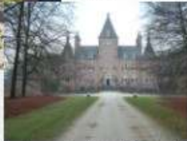
In de omgeving: Kasteel Renswoude

De boerderij 'De Kleine Weide' ligt in het kasteeldorp Renswoude in de Gelderse Vallei, dichtbij de bossen van de Utrechtse Heuvelrug, maar buiten de toeristische drukte. De boerderij is in 1933 gebouwd als melkveebedrijf maar inmiddels omgebouwd tot een bijzonder gemengd bedrijf.